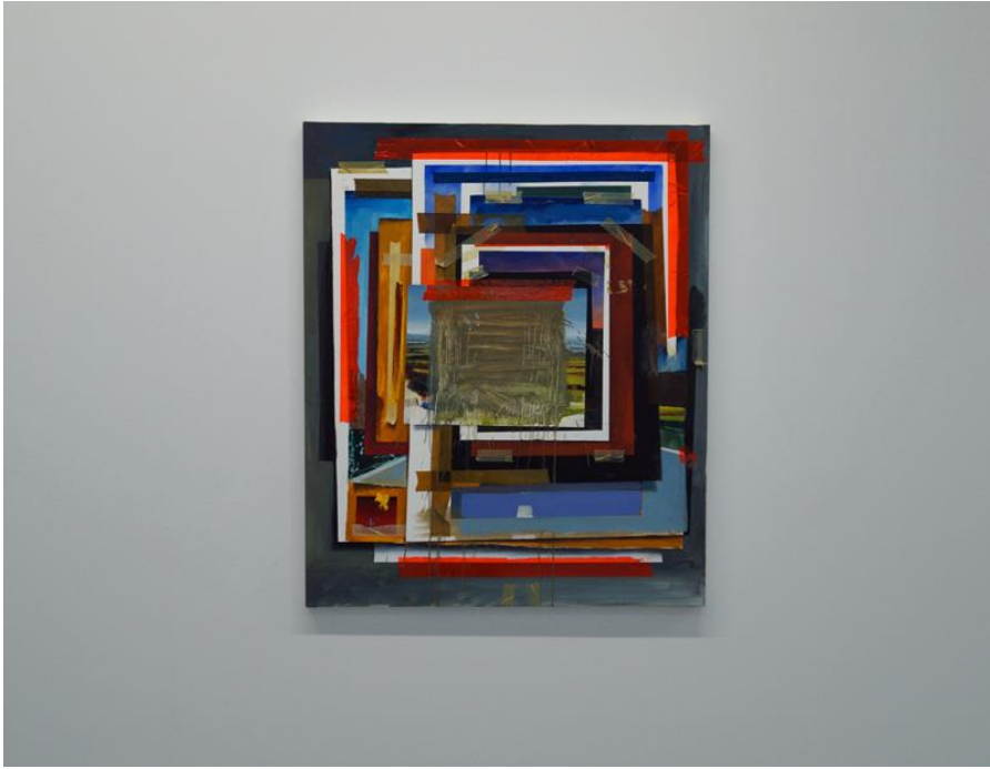
Oops on acid als het ware