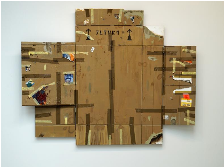
En vertrouwde kartonnen mindfuck, plaisir du tapeschilderij.