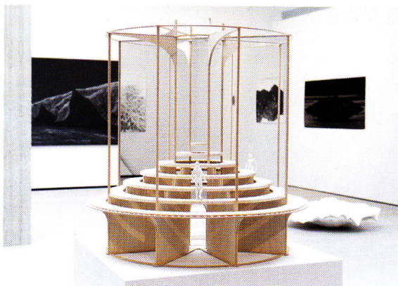
Werk van Inti Hernandez op de tentoonstelling Hermetic City