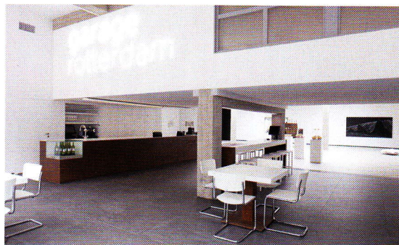
Garage Rotterdam